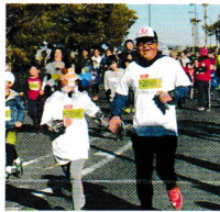
湘南藤沢市民マラソン 2019 親子ランに参加!