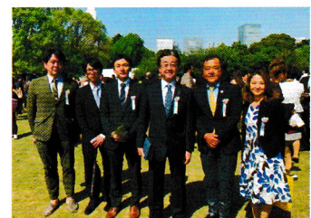
安倍総理主催「桜を見る会」にて地元同志とともに