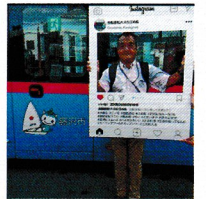
江ノ島自動運転バス実証実験出発式の一コマ