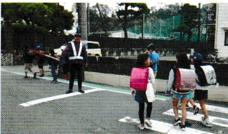
定例議会の前に、地元の小学校での交通安全街頭指導に!