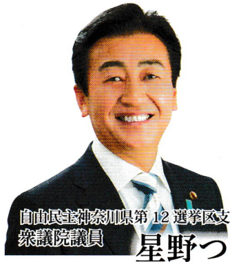
自由民主党神奈川県第12選挙区支部支部長 衆議院議員 星野つよし

今年は統一地方選挙と参議院議員選挙が重なる12年に1度の年であります。私たち自民党は政権政党としての責任を果たすとの決意を全員が共有しております。私は、日頃から地方議会の力こそ、自由民主党の力の源泉だと思っております。